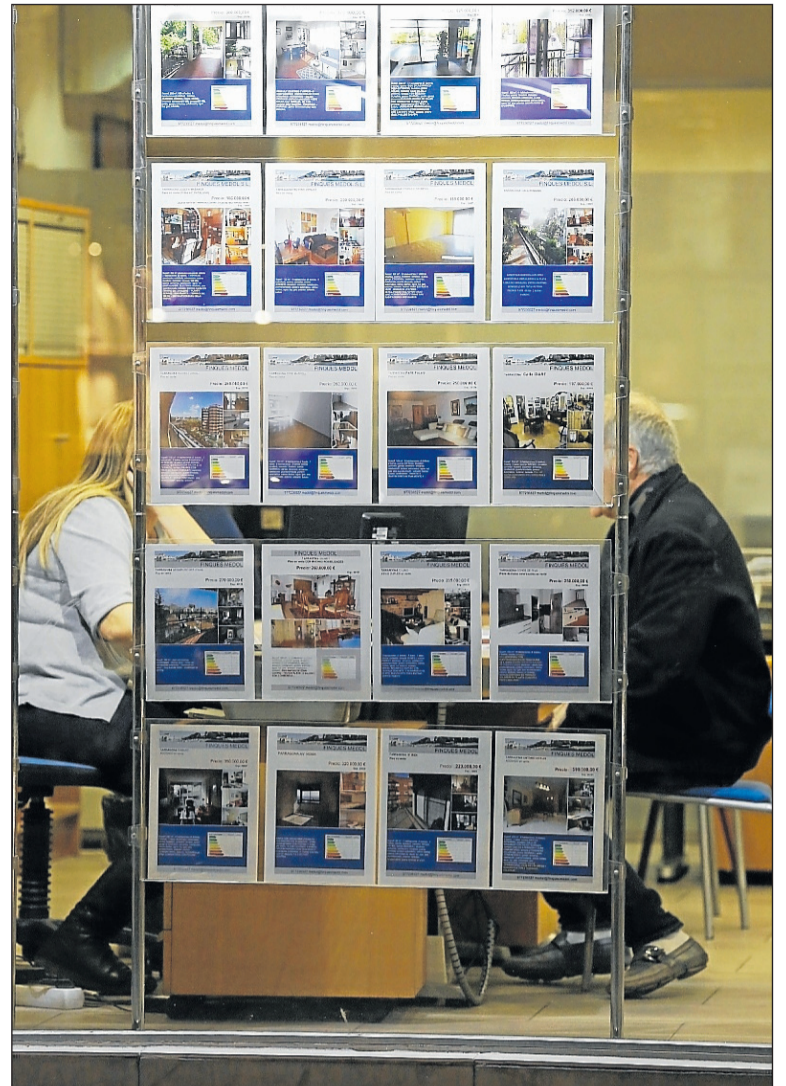
Algunas entidades mantienen las cláusulas suelo.

Aunque no es la única demanda que está estudiando la justicia europea. Previamente desde Barcelona se solicitó si es acorde al derecho europeo que miles de españoles tengan sus demandas paralizadas porque deben esperar a que un juzgado de Madrid resuelva un procedimiento colectivo. Sentencia que, además, les va a vincular aunque ni